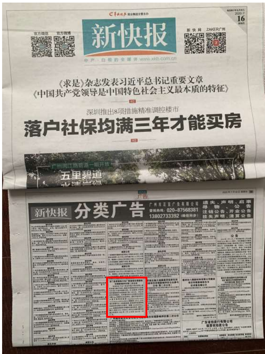
图 3.2-2 07月16日《新快报》环评信息公开版面截图