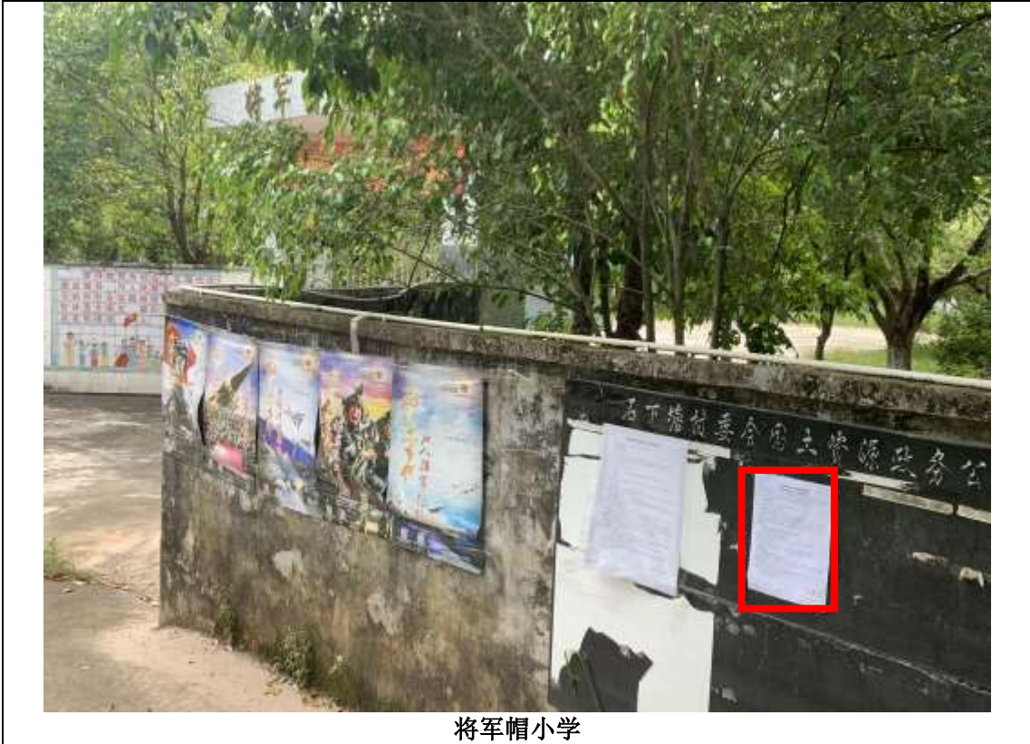
将军帽小学 图 3.2-4 现场张贴照片