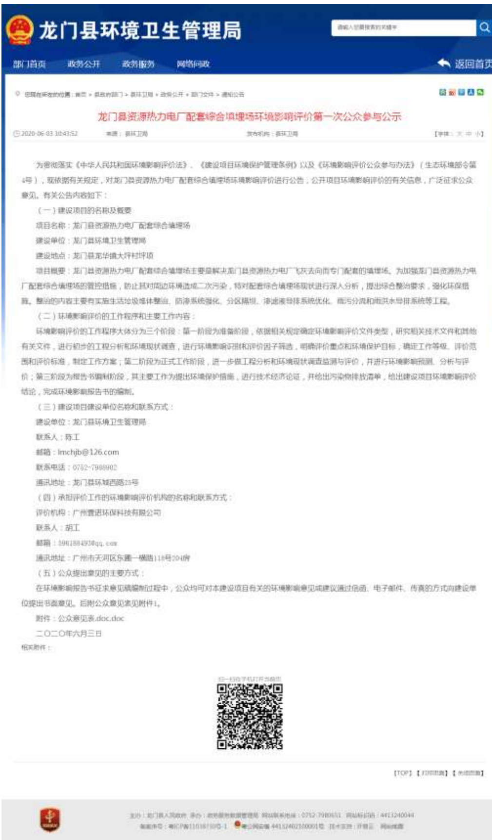
图 2.2-1 第一次网络公示截图